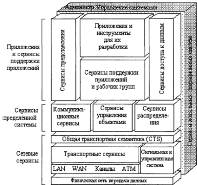
Рисунок 1 – Модель IBM OpenBlueprint фирмы IBM

Задача 2. Представьте сеть Интернет как распределенную открытую информационную систему в форме веб-графа. Свое решение поясните.